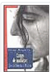
CAMPS DE MADUIXES SIERRA I FABRA