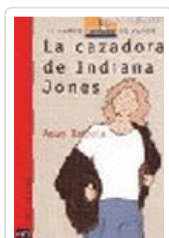
CAZADORA DE INDIANA JONES, LA BVR 53 BALZOLA