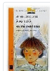
APARECIO EN MI VENTANA BVN 67 GOMEZ