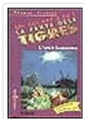
AVIO FANTASMA (V) TIGRES 3 BREZINA