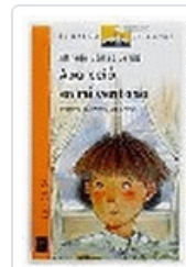
APARECIO EN MI VENTANA BVN 67 GOMEZ