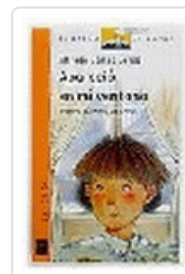
APARECIO EN MI VENTANA BVN 67 GOMEZ