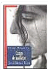
CAMPS DE MADUIXES SIERRA I FABRA