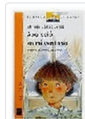
APARECIO EN MI VENTANA BVN 67 GOMEZ