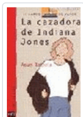
CAZADORA DE INDIANA JONES, LA BVR 53 BALZOLA