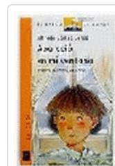
APARECIO EN MI VENTANA BVN 67 GOMEZ