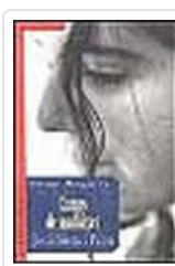
CAMPS DE MADUIXES SIERRA I FABRA