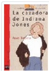
CAZADORA DE INDIANA JONES, LA BVR 53 BALZOLA