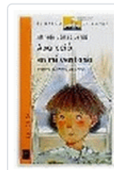
APARECIO EN MI VENTANA BVN 67 GOMEZ