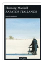
ZAPATOS ITALIANOS (ANDANZAS 643) MANKELL, HENNING