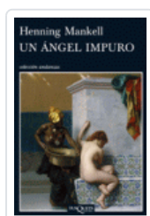
ANGEL IMPURO, UN (ANDANZAS 774) MANKELL, HENNING