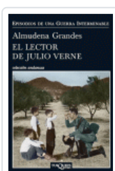
LECTOR DE JULIO VERNE, EL (ANDANZAS 730/2) GRANDES HERNANDEZ, ALMUDENA