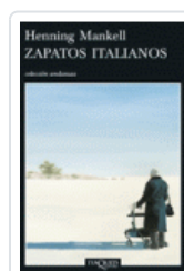
ZAPATOS ITALIANOS (ANDANZAS 643) MANKELL, HENNING