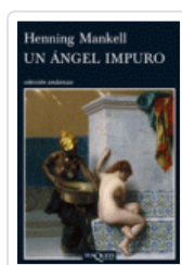
ANGEL IMPURO, UN (ANDANZAS 774) MANKELL, HENNING