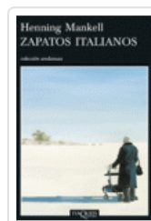
ZAPATOS ITALIANOS (ANDANZAS 643) MANKELL, HENNING