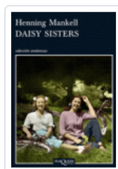
DAISY SISTERS (ANDANZAS 764) MANKELL, HENNING