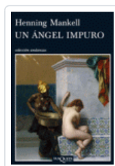
ANGEL IMPURO, UN (ANDANZAS 774) MANKELL, HENNING