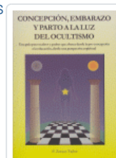
CONCEPCION, EMBARAZO Y PARTO A LA LUZ DEL OCULTISMO ZERAUS TADOR, F