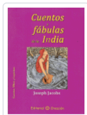
CUENTOS Y FABULAS DE LA INDIA JACOBS, JOSEPH