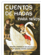
CUENTOS DE HADAS PARA NIÑOS TADOR, ZERAUS