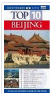
BEIJING TOP TEN