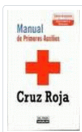
MANUAL DE PRIMEROS AUXILIOS-CRUZ ROJA