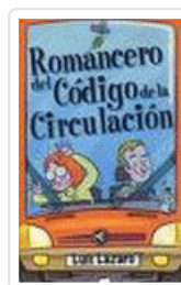
ROMANCERO DEL CODIGO DE CIRCULACION LAZARO, LUIS