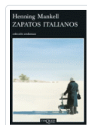
ZAPATOS ITALIANOS (ANDANZAS 643) MANKELL, HENNING