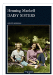
DAISY SISTERS (ANDANZAS 764) MANKELL, HENNING