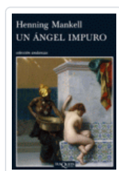
ANGEL IMPURO, UN (ANDANZAS 774) MANKELL, HENNING