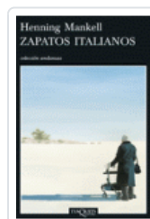
ZAPATOS ITALIANOS (ANDANZAS 643) MANKELL, HENNING