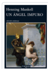
ANGEL IMPURO, UN (ANDANZAS 774) MANKELL, HENNING