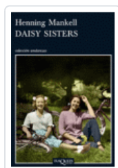
DAISY SISTERS (ANDANZAS 764) MANKELL, HENNING