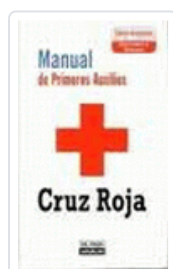
MANUAL DE PRIMEROS AUXILIOS-CRUZ ROJA