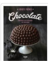
CHOCOLATE RECETAS CON UN TOQUE DE FELICIDAD MANGAS, SANDRA