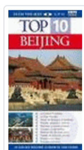
BEIJING TOP TEN