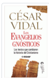
EVANGELIOS GNOSTICOS, LOS VIDAL, CESAR