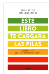
ESTE LIBRO TE CARGARA LAS PILAS FEXEUS, HENRIK / ENBLAD, CATHARINA