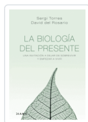
BIOLOGIA DEL PRESENTE, LA TORRES, SERGI / ROSARIO, DAVID DEL