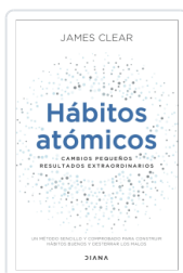
HABITOS ATOMICOS CLEAR, JAMES