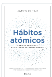
HABITOS ATOMICOS CLEAR, JAMES