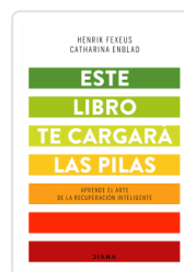
ESTE LIBRO TE CARGARA LAS PILAS FEXEUS, HENRIK / ENBLAD, CATHARINA