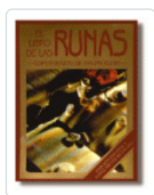
LIBRO DE LAS RUNAS [KIT] BLUM, RALPH