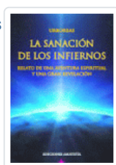
SANACION DE LOS INFIERNOS, LA URBOREAS