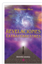
REVELACIONES EXTRATERRESTRES MAM, RAMAATHIS