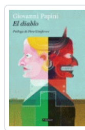
DIABLO, EL (BACKLIST) PAPINI, GIOVANNI