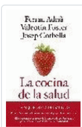
COCINA DE LA SALUD, LA (6ªED) VV.AA.