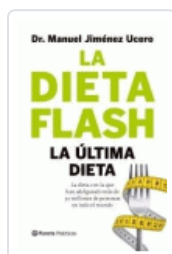
DIETA FLASH, LA JIMENEZ, MANUEL