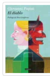
DIABLO, EL (BACKLIST) PAPINI, GIOVANNI