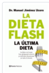
DIETA FLASH, LA JIMENEZ, MANUEL