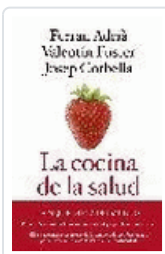
COCINA DE LA SALUD, LA (6ªED) VV.AA.