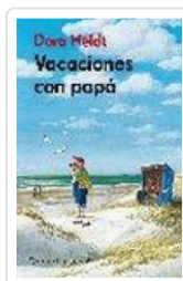
VACACIONES CON PAPA HELDT, DORA