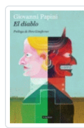
DIABLO, EL (BACKLIST) PAPINI, GIOVANNI