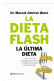
DIETA FLASH, LA JIMENEZ, MANUEL