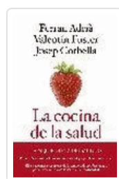
COCINA DE LA SALUD, LA (6ªED) VV.AA.