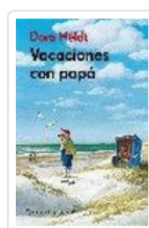
VACACIONES CON PAPA HELDT, DORA