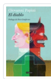
DIABLO, EL (BACKLIST) PAPINI, GIOVANNI