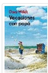
VACACIONES CON PAPA HELDT, DORA