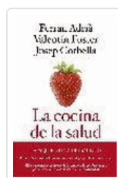
COCINA DE LA SALUD, LA (6ªED) VV.AA.