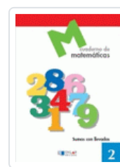
CUADERNO MATEMATICAS 02 DYLAR