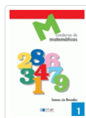
CUADERNO MATEMATICAS 01 DYLAR