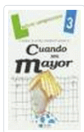
CUANDO SEA MAYOR JUEGO 3 DYLAR