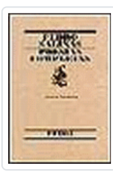
POESIAS COMPLETAS DE PEDRO SALINAS