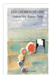
GNOMOS DE GNU, LOS ECO, UMBERTO