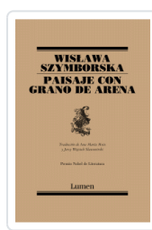
PAISAJE CON GRANO DE ARENA (POESIA) SZYMBORSKA