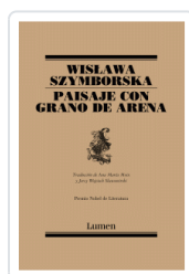
PAISAJE CON GRANO DE ARENA (POESIA) SZYMBORSKA