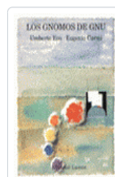
GNOMOS DE GNU, LOS ECO, UMBERTO