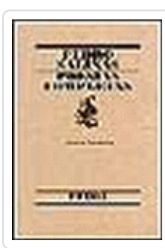
POESIAS COMPLETAS DE PEDRO SALINAS