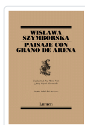
PAISAJE CON GRANO DE ARENA (POESIA) SZYMBORSKA