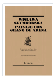
PAISAJE CON GRANO DE ARENA (POESIA) SZYMBORSKA