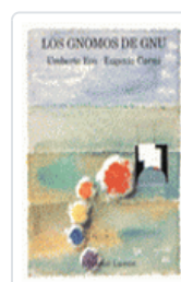
GNOMOS DE GNU, LOS ECO, UMBERTO