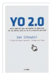
YO 2.0 SCHAWBEL, DAN