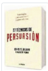
27 TÉCNICAS DE PERSUASION HILAIRE, CHRIS ST.