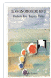
GNOMOS DE GNU, LOS ECO, UMBERTO