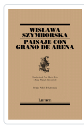
PAISAJE CON GRANO DE ARENA (POESIA) SZYMBORSKA