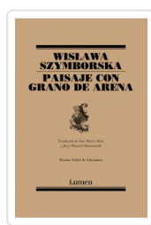
PAISAJE CON GRANO DE ARENA (POESIA) SZYMBORSKA