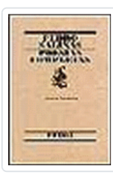
POESIAS COMPLETAS DE PEDRO SALINAS