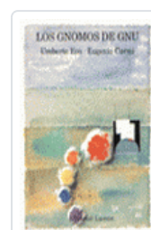
GNOMOS DE GNU, LOS ECO, UMBERTO