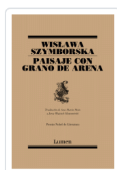
PAISAJE CON GRANO DE ARENA (POESIA) SZYMBORSKA