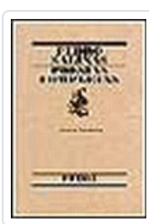
POESIAS COMPLETAS DE PEDRO SALINAS