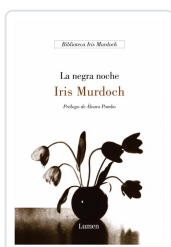
NEGRA NOCHE, LA Murdoch, Iris