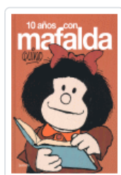
10 AÑOS CON MAFALDA QUINO