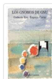
GNOMOS DE GNU, LOS ECO, UMBERTO