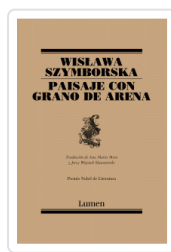
PAISAJE CON GRANO DE ARENA (POESIA) SZYMBORSKA