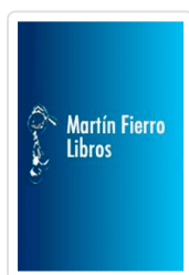
DAMAS DE ORIENTE, LAS MORATO, CRISTINA