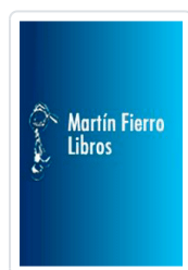
DIARIO DE UNA NINFOMANA TASSO, V.