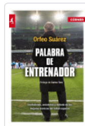
PALABRA DE ENTRENADOR 2º ED. SUAREZ, ORFEO