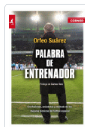
PALABRA DE ENTRENADOR 2º ED. SUAREZ, ORFEO