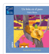
LEON EN PARO, UN (TREN AZUL) HOMS SERRA, NURIA / CANALS, MERCE IL.