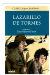
LAZARILLO DE TORMES (CLASICOS PARA ESTUDIANTES) NAVARRO DURAN, ROSA