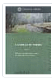
LAZARILLO DE TORMES (CLASICOS) CREUS VISIERS, EDUARDO ED.