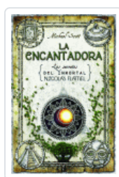
ENCANTADORA (SECRETOS INMORTAL NICOLAS FLAME VI) SCOTT, MICHAEL