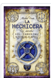
HECHICERA (SECRETOS INMORTAL NICOLAS FLAME VI) SCOTT, MICHAEL