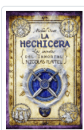
HECHICERA (SECRETOS INMORTAL NICOLAS FLAME VI) SCOTT, MICHAEL