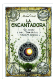
ENCANTADORA (SECRETOS INMORTAL NICOLAS FLAME VI) SCOTT, MICHAEL