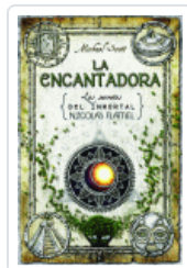
ENCANTADORA (SECRETOS INMORTALES NICOLAS FLAME V) SCOTT, MICHAEL