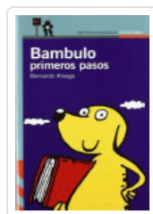
BAMBULO PRIMEROS PASOS (P-P) 10 AÑOS ATXAGA, BERNARDO