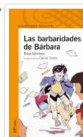
BARBARIDADES DE BARBARA, LAS (P-P 10) MONTERO, ROSA