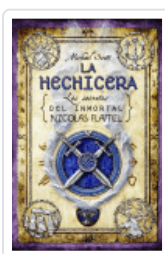
HECHICERA (SECRETOS INMORTAL NICOLAS FLAME VI) SCOTT, MICHAEL