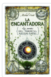
ENCANTADORA (SECRETOS INMORTAL NICOLAS FLAME VI) SCOTT, MICHAEL