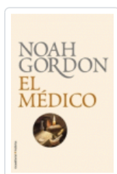
MEDICO (ED. 25 ANIV.) GORDON, NOAH