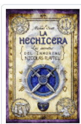
HECHICERA (SECRETOS INMORTAL NICOLAS FLAME) SCOTT, MICHAEL