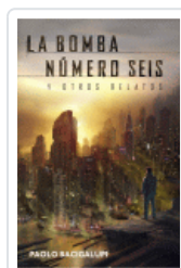
BOMBA NUMERO SEIS Y OTROS RELATOS, LA BACIGALUPI, PAOLO