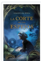
CORTE DE LOS ESPEJOS, LA PEREA, CONCEPCION