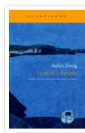
MUJER Y EL PAISAJE ZWEIG, STEFAN