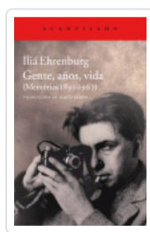
GENTE, AÑOS, VIDA EHRENBURG, ILIA