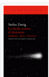
LUCHA CONTRA EL DEMONIO (HOLDERLIN - KLEIST - NIETZSCHE) ZWEIG, STEFAN